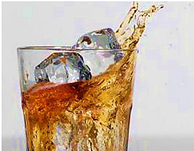
ภาพประกอบจากอินเตอร์เน็ต

ถูกใจ เป็นคนแรกของคุณของคุณที่ถูกใจสิ่งนี้